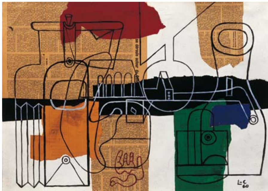
Le Corbusier | Bouteilles | 1960 | Artista suíço