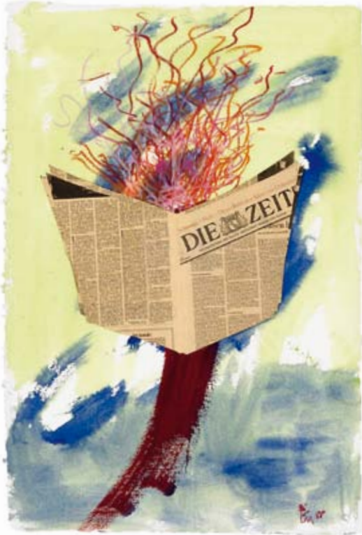
Kurt Laurenz Metzler | Zeitungsleser [2] | 1988 | Artista suíço